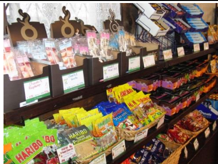
お土産もカラフルです 英語で買い物もしました