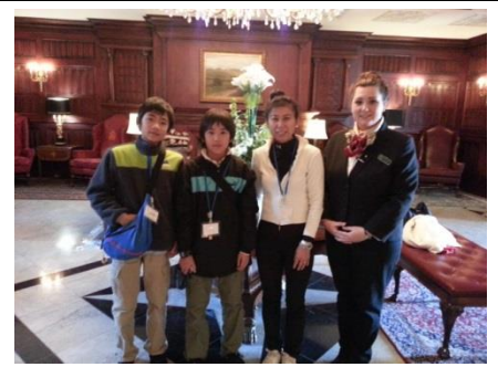
マナーハウス(荘園領主の館) エントランスにて