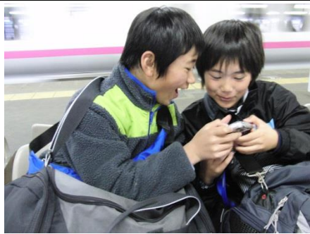
出発の朝、大宮駅にて