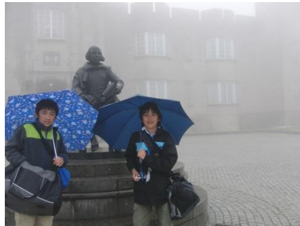
翌朝は霧が出ていました シエークスピアの像の前で