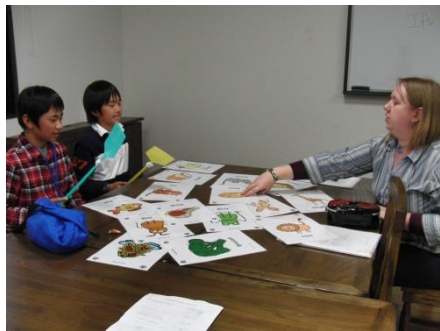
簡単なゲームを英語でしました