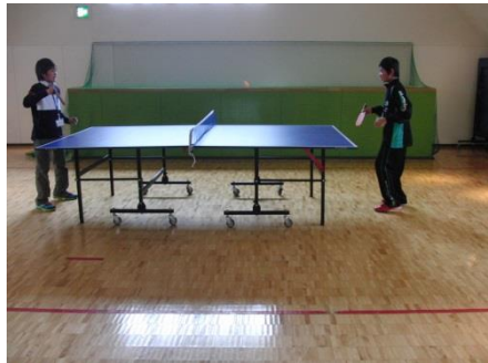
卓球(table tennis) とっても楽しかったです