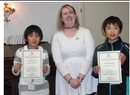
修了式 又一つ自信ができました