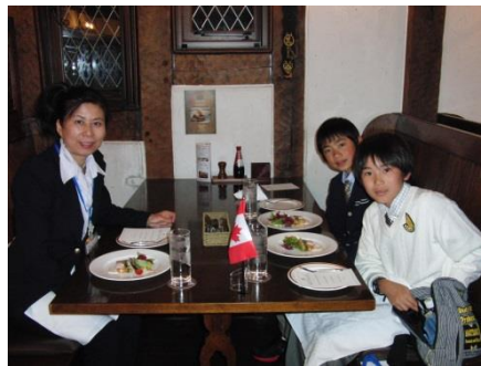
パブでのディナー とにかく美味しいご馳走でした