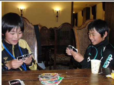
夜はカードゲームで対戦