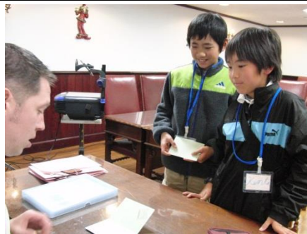
パスポートコントロール 外国の入国そっくりでした